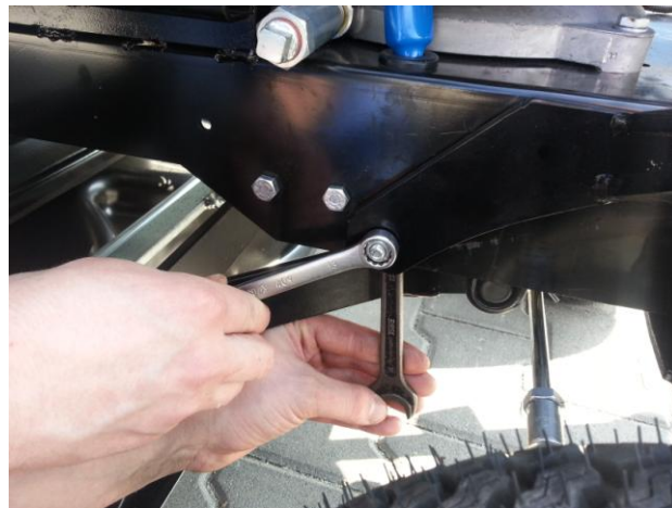
11. Všechny šrouby řádně dotáhněte na obou stranách traktoru pomocí dvou klíčů Alle Schrauben auf beiden Seiten des Traktors mit zwei Schlüsseln sorgfältig festziehen.