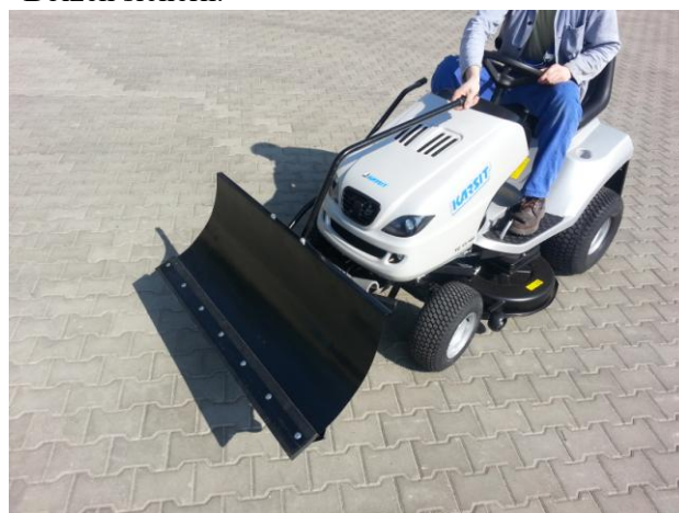
15. Středová páka slouží při zvednuté radlici k natočení úhlu z místa řidiče odjištěním mechanismu zmačknutí páky dolů a zároveň k natočení do požadovaného úhlu.

Die Mittelhebel dient beim angehobenen Schneeräumschild zum Einstellen des Winkels vom Fahrersitz aus, indem der Mechanismus durch Herunterdrücken des Hebels entriegelt und gleichzeitig auf den gewünschten Winkel gedreht wird.