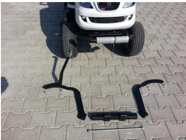
Pravý díl rámu s hákem + střední díl rámu + levý díl rámu Rechtes Rahmenteil mit Haken + mittleres Rahmenteil + linkes Rahmenteil