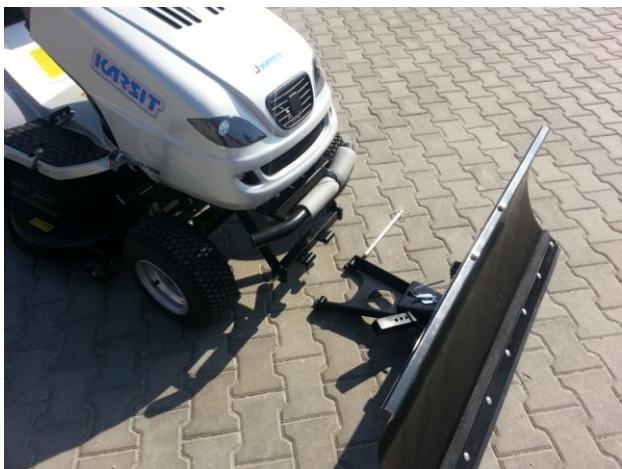
12. Radlici nalícujte k rámu Schneeräumschild am Rahmen ausrichten.