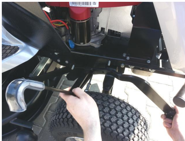
2. Na šrouby nasadíte díl s hákem. Teil mit Haken auf die Schrauben aufsetzen.