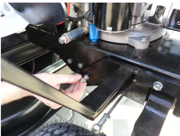
3. Na šrouby nasadíte podložky a matice a lehce dotáhněte Unterlegscheiben und Muttern auf die Schrauben aufsetzen und nur leicht anziehen.