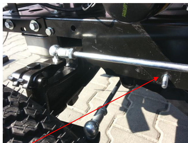
4. Na levé straně traktoru nasadíte zatím pouze 1 šroub zevnitř šasí. Auf der linken Seite des Traktors vorerst nur 1 Schraube von innen am Chassis einsetzen.