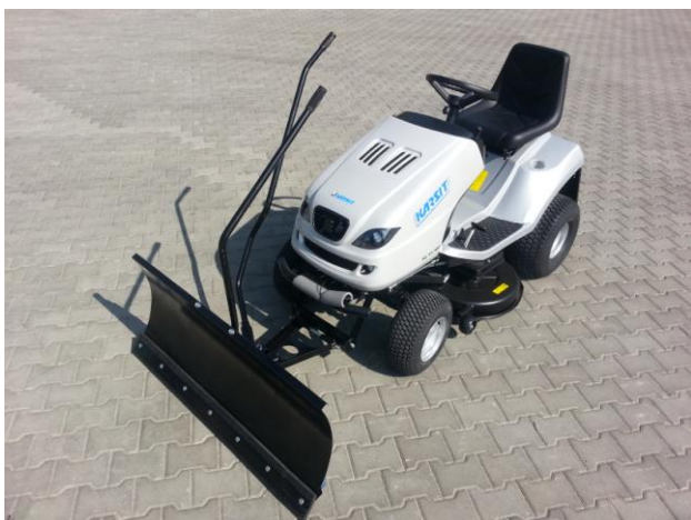
14. Radlice připravená k provozu Schneeräumschild einsatzbereit.