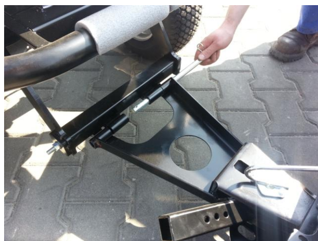
13. Nasad'te díl radlice do rámu a zajistěte kolíkem Schneeräumschildteil in den Rahmen einsetzen und mit Bolzen sichern.