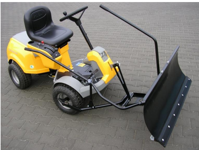
9. Poloha radlice - zvednutá.