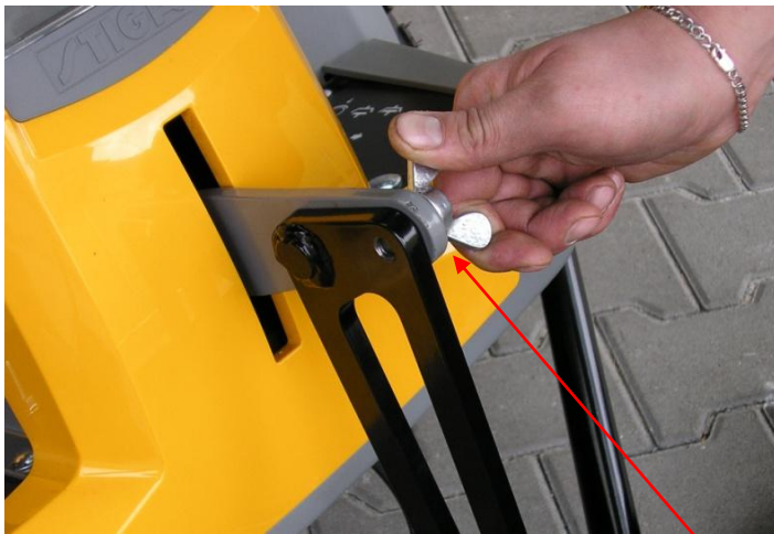
5. Nastrčte táhlo čepem do zdvihu příslušenství a dotáhněte křídlatým šroubem.