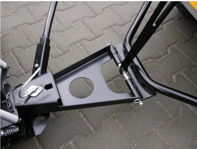
7. Čep zajistěte závlačkou.