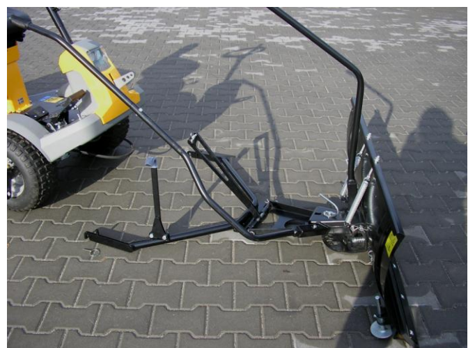
10. Snadné sundání celého rámu současně s radlicí odháknutím z držáků na kolech a odmontováním táhla křídlatým šroubem.