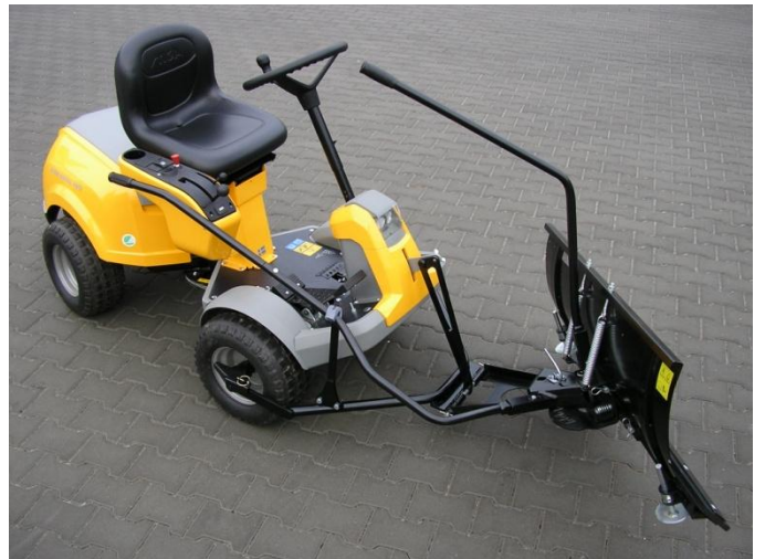
8. Nasazená radlice na rámu traktoru, nasazená zvedací a ovládací páka.