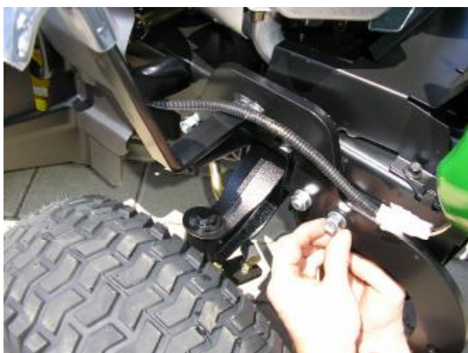
3. Našroubujte matice s podložkami, ale nedotahujte ! Muttern mit Unterlegscheiben aufschrauben, aber nicht festziehen!