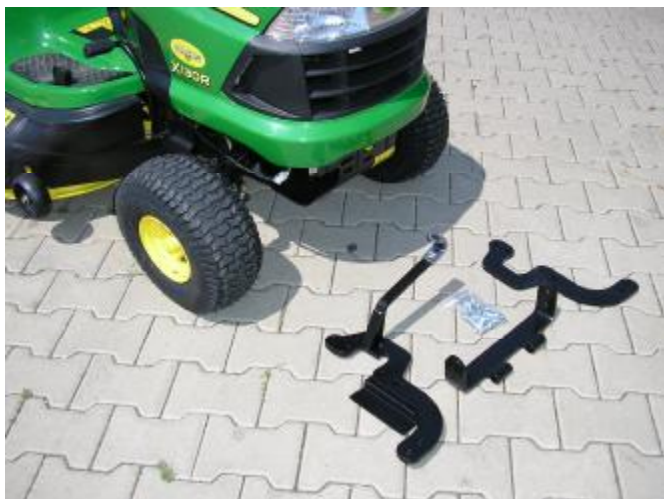
Pravý díl rámu s hákem + střední díl rámu + levý díl rámu Rechtes Rahmenteil mit Haken + mittleres Rahmenteil + linkes Rahmenteil