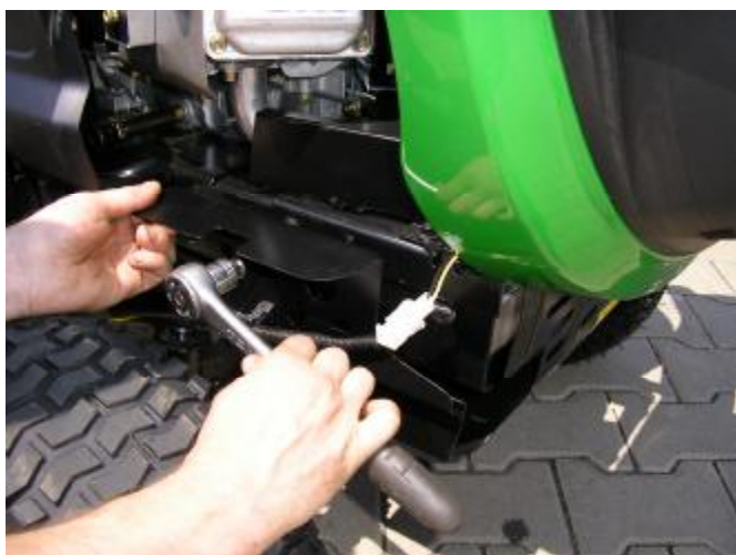
1. Odmontujte z pravé strany šasí krycí plech výfuku Abdeckblech des Auspuffs auf der rechten Seite des Fahrgestells abmontieren.