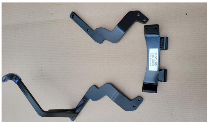
Pravý díl rámu s hákem + střední díl rámu + levý díl rámu Rechtes Rahmenteil mit Haken + mittleres Rahmenteil + linkes Rahmenteil