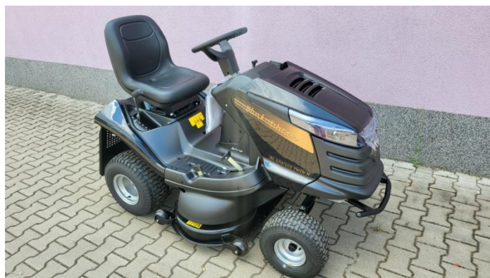
Traktor BL 270 102 TWIN H Black Edition