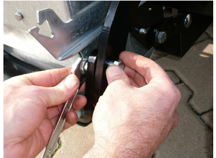
6. ...und oben mit Schrauben M10 x 30 befestigen.