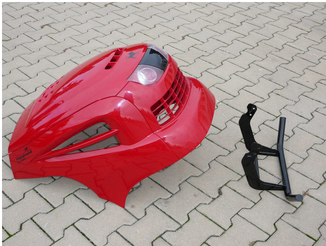
1. Motorhaube abnehmen und Stoßstange abbauen.