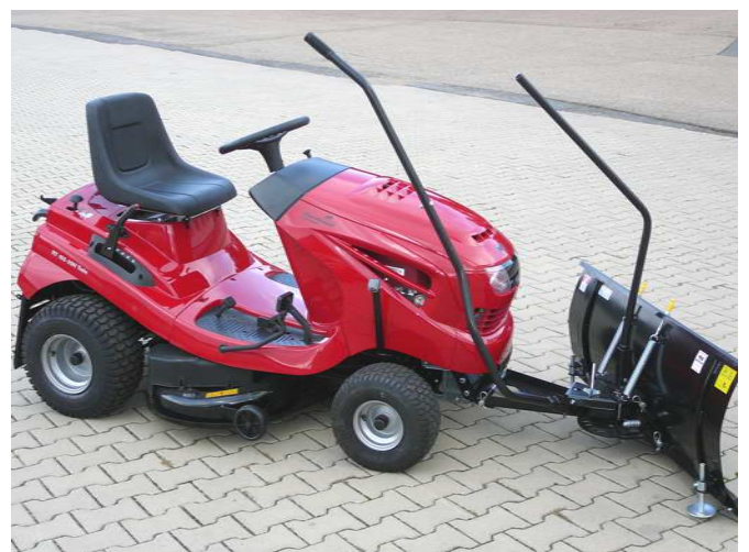
10. Gesichertes Schneeräumschild am Traktorraahmen, aufgesetzter Hub- und Steuerhebel.