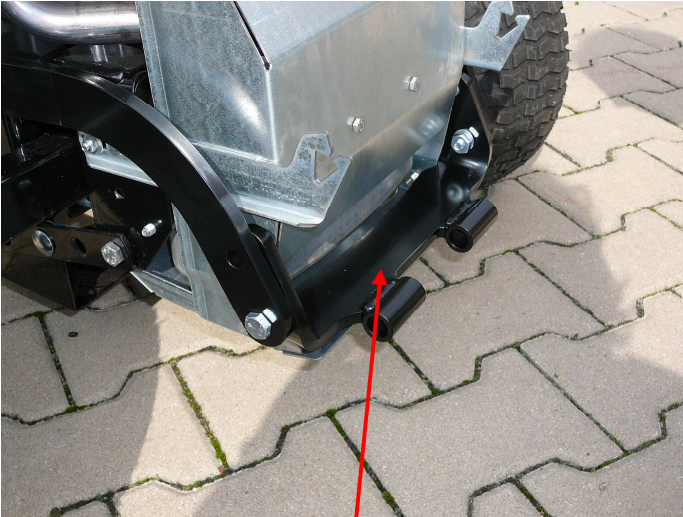
5. Mittleren Teil unten mit Schrauben M10 x 35 befestigen.