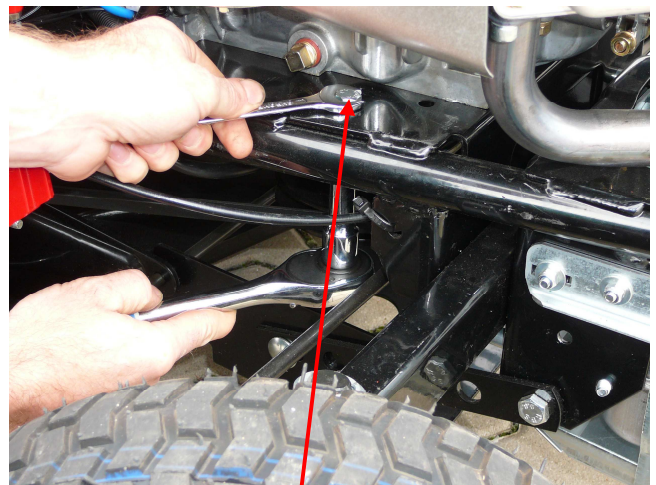
2. Markierte Schraube M8 auf beiden Seiten des Motors entfernen.