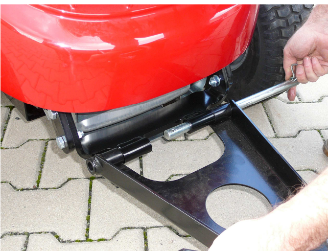
9. Befestigen Sie das Schneeräumschild und sichern Sie es mit einem Bolzen.