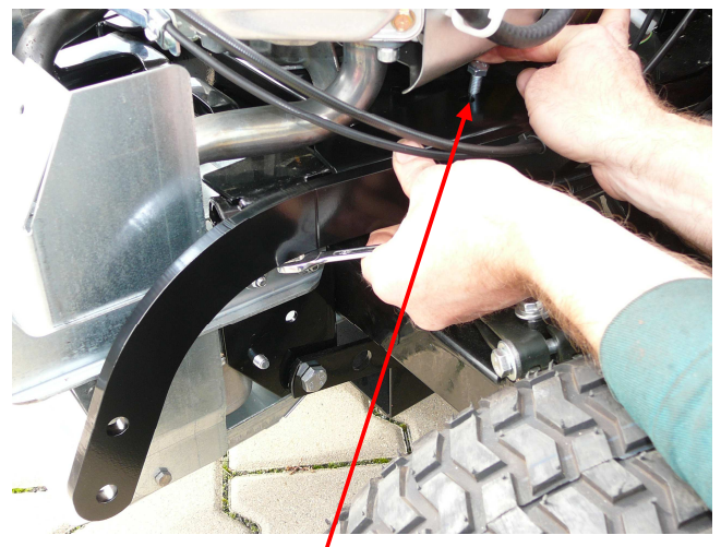
4. Rahmenteil ohne Haken auf die linke Seite des Fahrgestells aufschieben. Schraube M8 x 25 einsetzen, mit Originalunterlegscheibe und -mutter sichern und von Hand festziehen.