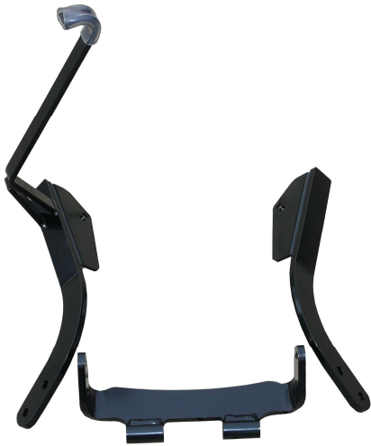
Rechtes Rahmenteil mit Haken + mittleres Rahmenteil + linkes Rahmenteil