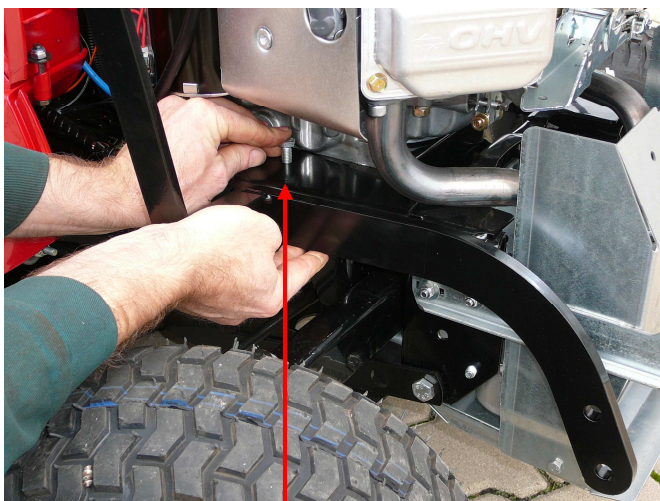
3. Rahmenteil mit Haken von der Seite auf die rechte Seite des Fahrgestells aufschieben. Schraube M8 x 25 einsetzen, mit Originalunterlegscheibe und -mutter sichern und von Hand festziehen.