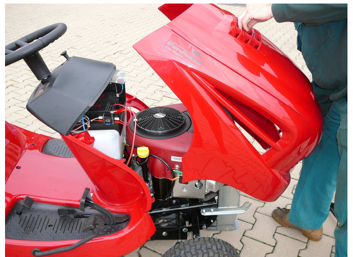
8. Setzen Sie die Motorhaube wieder auf.