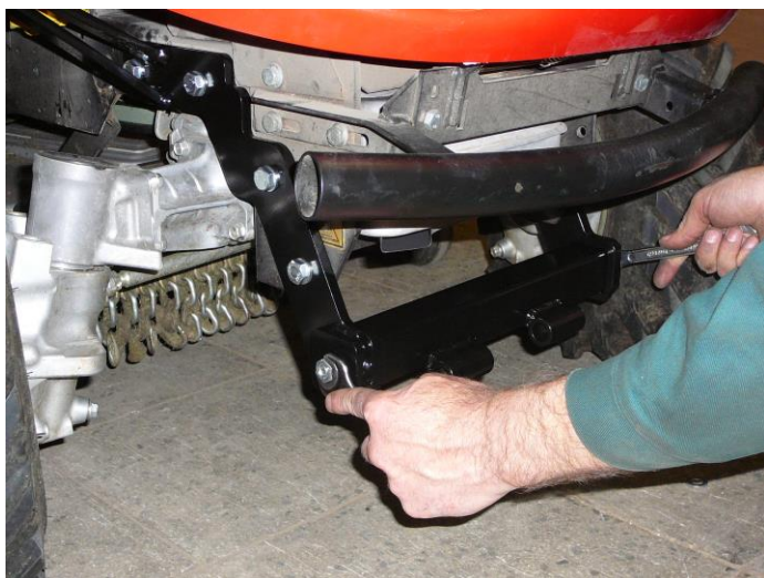
7. Matky vycentrujte a řádně dotáhněte.