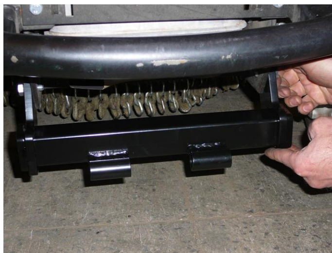
4. Nasad'te střední díl rámu .