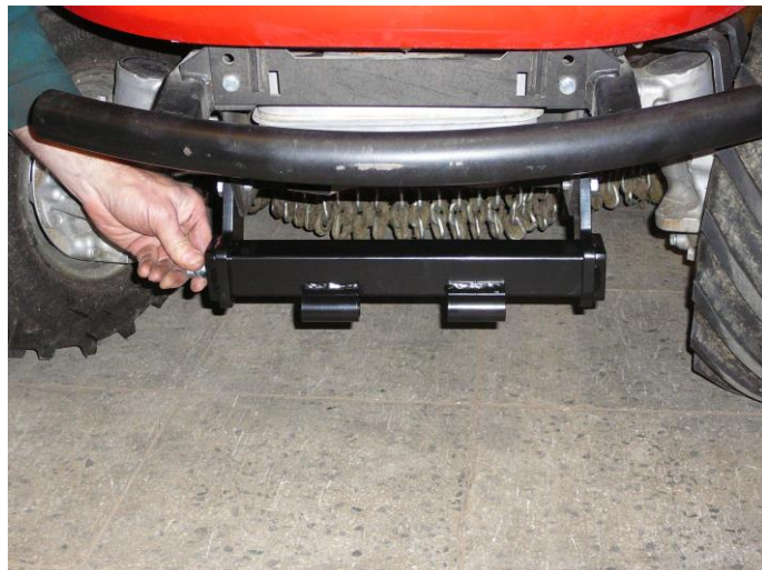
6. Prostrčte závitovou tyč skrz boky a prostředním dílem rámu . Zajistěte matkami.