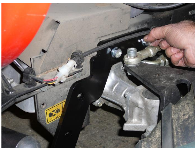
3. Přiložte druhý díl rámu na levou stranu traktoru , vložte horní šrouby.