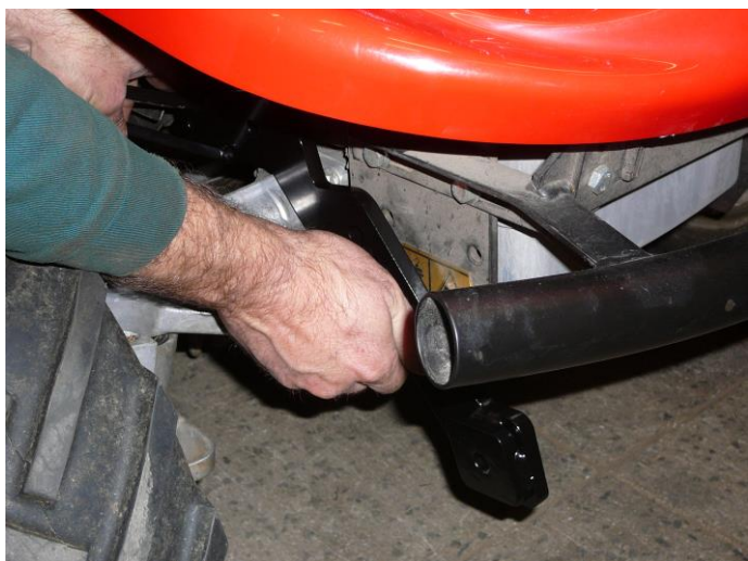
1. Přiložte rám s hákem na pravou stranu traktoru.