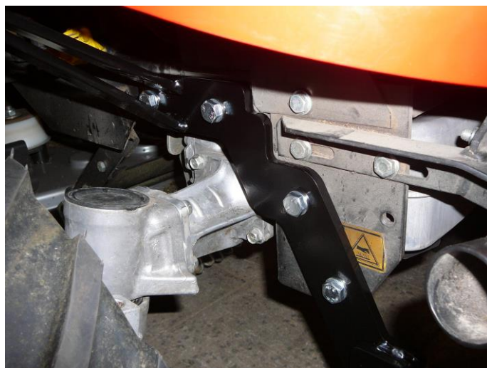
2. Vložte šrouby a dotáhněte.