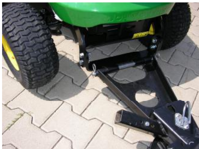
11. Pro připojení radlice vytočte kola do strany a radlici zajistěte čepem.