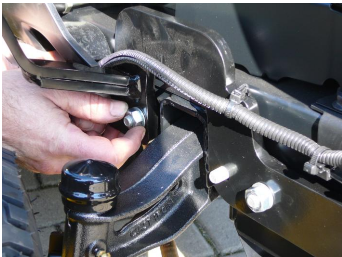
6. Z pravé strany šasi provlékněte bok rámu s hákem .