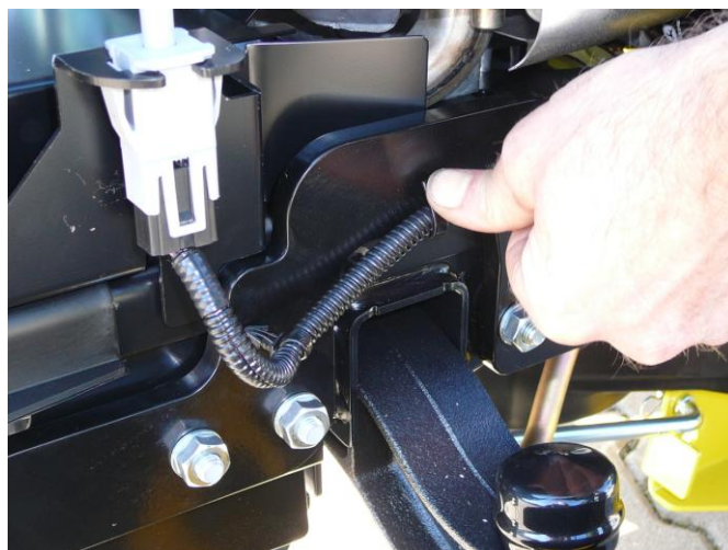
9. Z levé strany přiložte bok rámu ,přišroubujte, dotáhněte. Kabel provlékněte připraveným očkem a přimáčkněte.