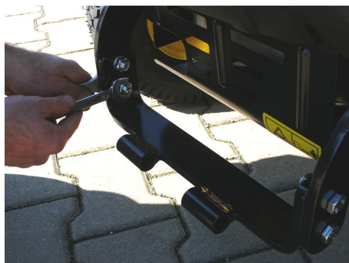
10. Nasadte šrouby a matice do přední části rámu a všechny řádně dotáhněte klíčem.