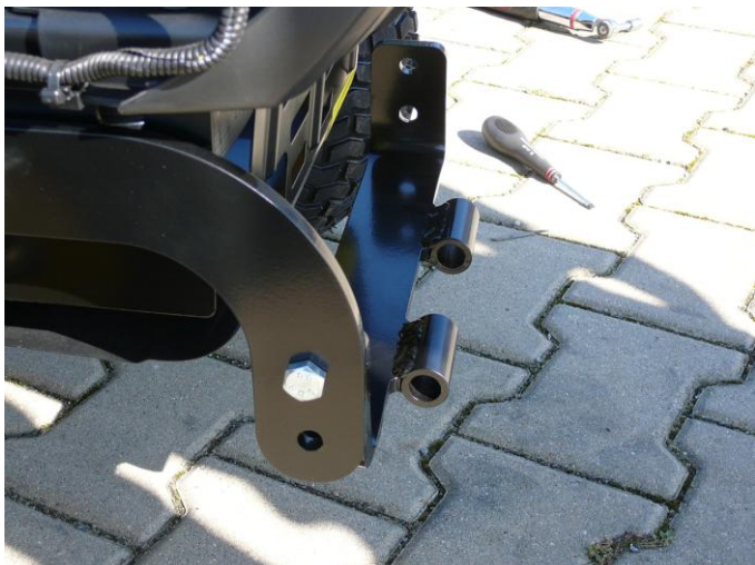
8. Přiložte přední díl rámu a přichytněte šroubem a maticí.